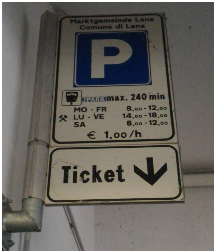
Abbildung 2: Beschilderung Tiefgarage