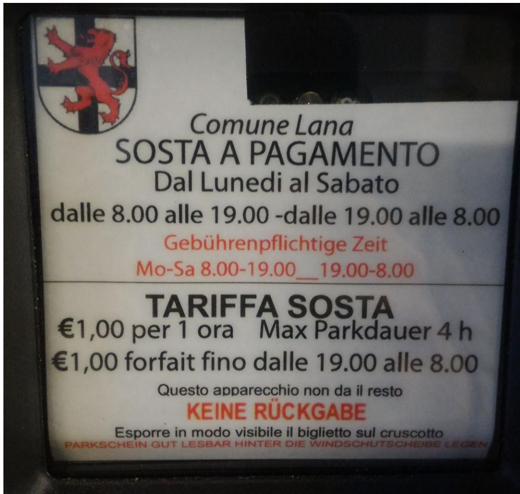
Abbildung 1: Beschriftung Parkautomat