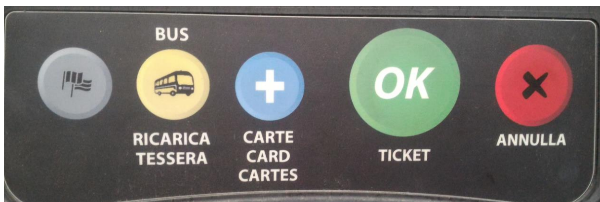
Abbildung 3: Bedienknöpfe Parkautomat